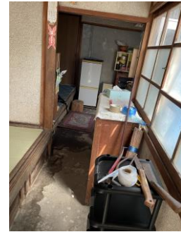
【 損傷箇所 】